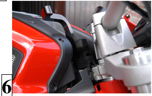
Patte 696 Monster