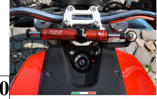
Vis Button M8x20